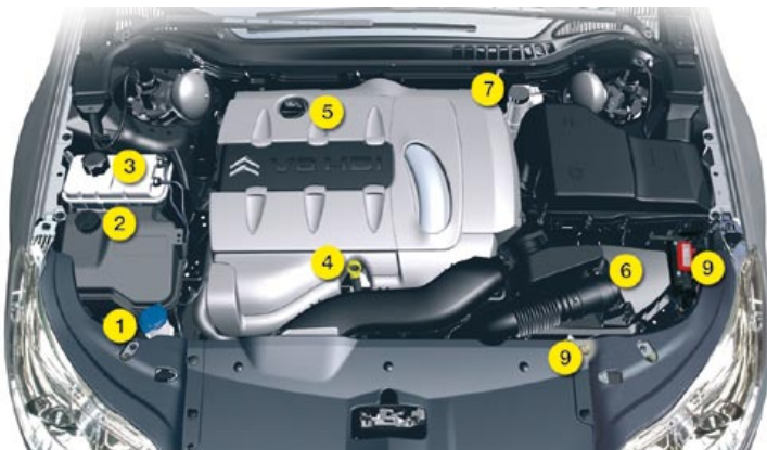
V6 HDi 208