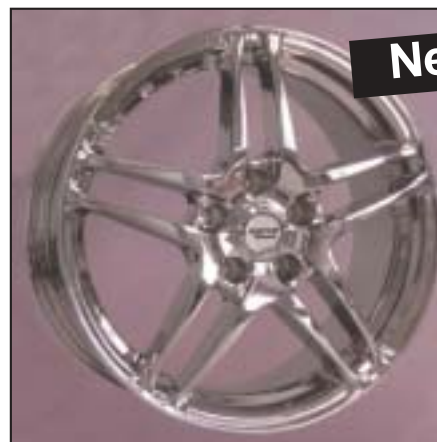
▲ 15.31 / 17.31