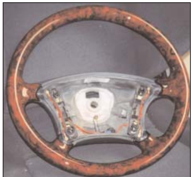
▲ 3.3 b