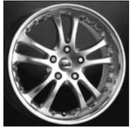
▲ 16.03 / 17.03 / 18.03