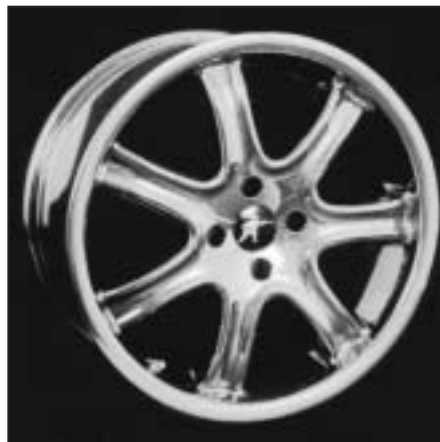
▲ 16.112 / 17.112 / 18.112