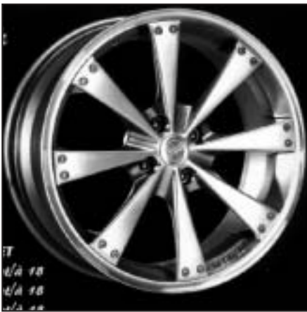
▲ 15.20 / 17.20 / 18.20