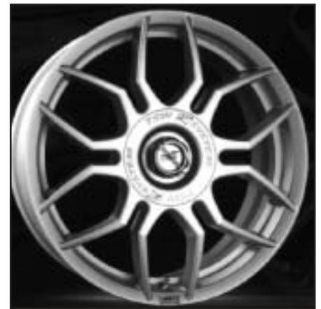
▲ 15.45 / 16.45 / 17.45