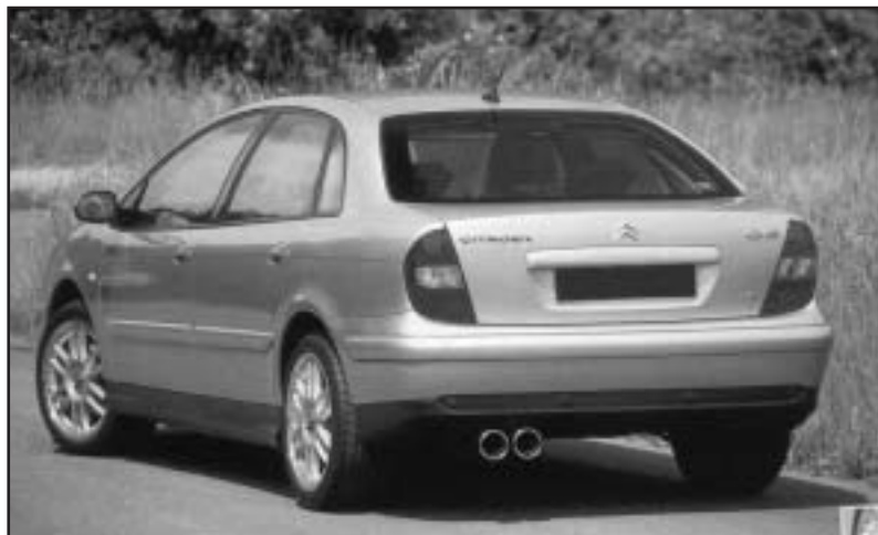
▲ 8.10 a