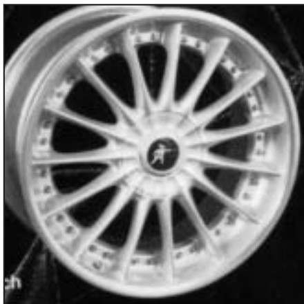
▲ 18.117 a/b/c