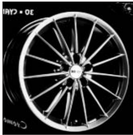
▲ 17.21 / 18.21