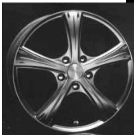
▲ 15.63 / 17.63