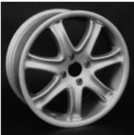
▲ 16.111 / 17.111 / 18.111