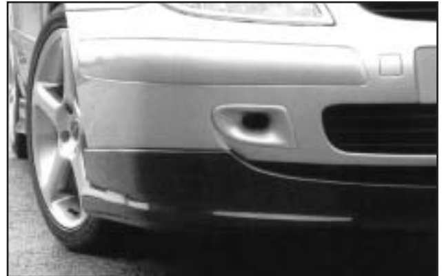
▲ 5.1 / 5.5