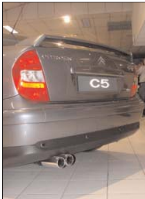
▲ 8.10 a