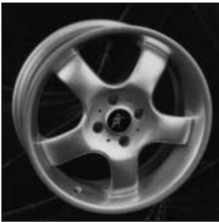
▲ 15.105 / 16.105 / 17.105