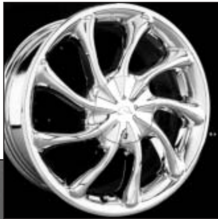
▲ 15.15 / 16.15 / 17.15