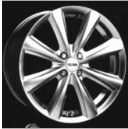
▲ 15.12 / 16.12 / 17.12