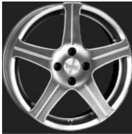
▲ 17.70 / 18.70