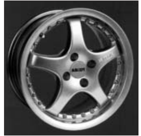
▲ 15.13 / 16.13 / 17.13