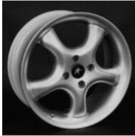
▲ 15.101 / 16.101