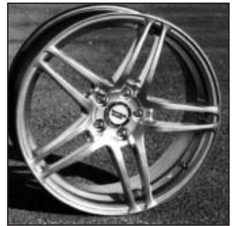
▲ 15.30 / 17.30