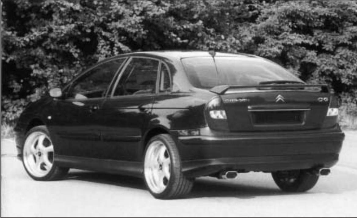
▲ 8.7 a