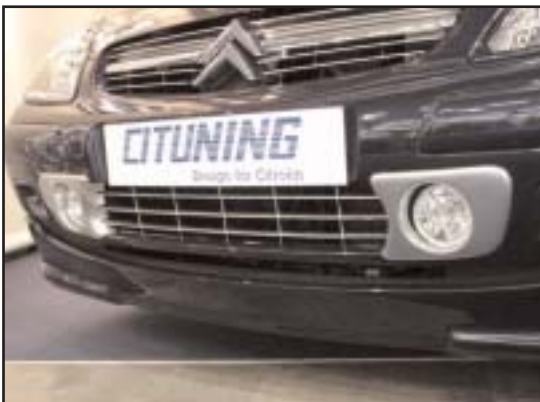
▲ 5.6 / 5.7 a / 5.7 b / 5.7 c