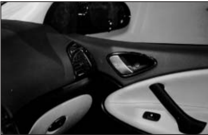
▲ 3.1 / 3.2