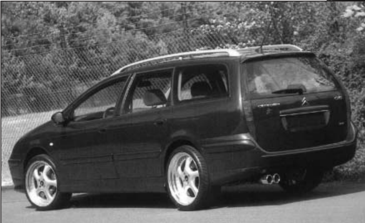
▲ 8.10 b