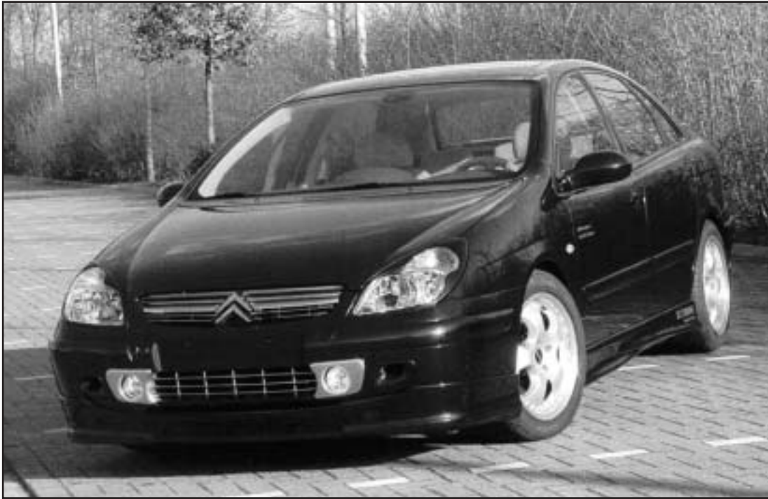
▲ 5.1 / 5.2 / 5.5 / 5.6 / 5.7 a / 5.7 b / 5.7 c