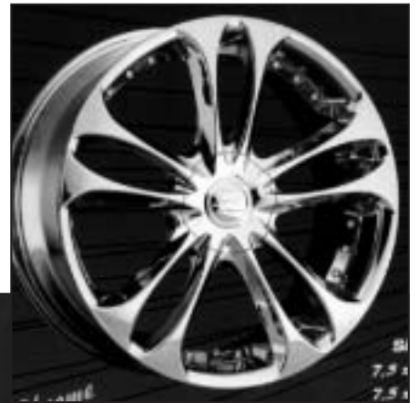
▲ 17.23 a/b / 18.23 a/b