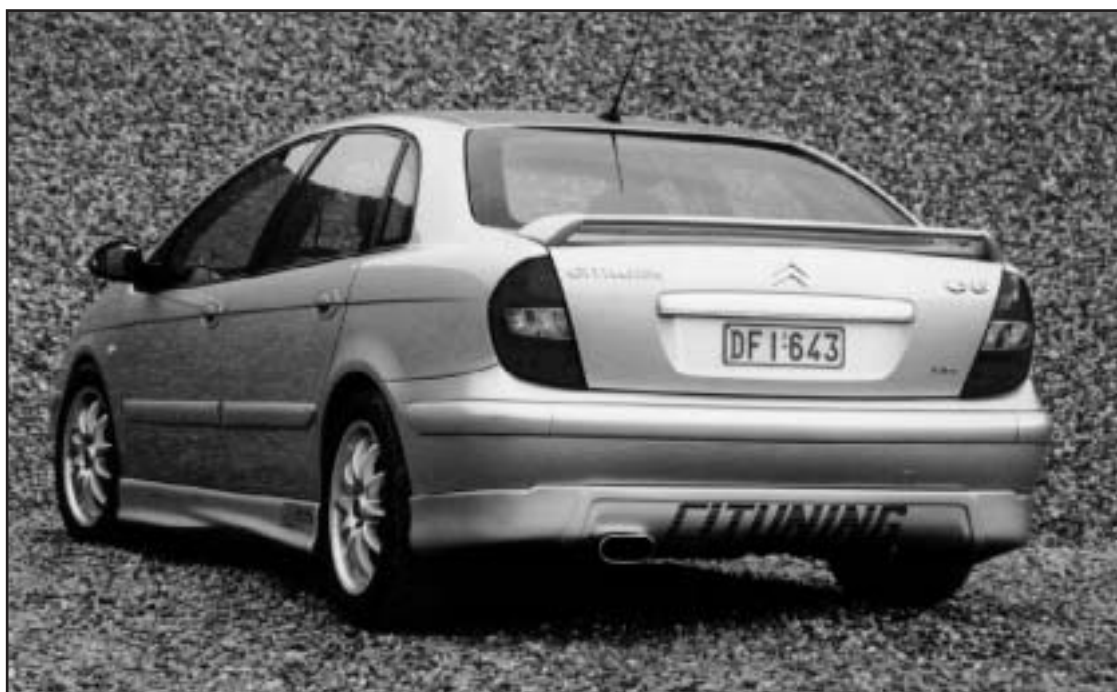
▲ 5.2 / 5.3 a / 5.4 / 8.11