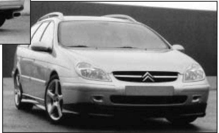
▲ 1.1 / 5.1 / 5.2 / 5.5