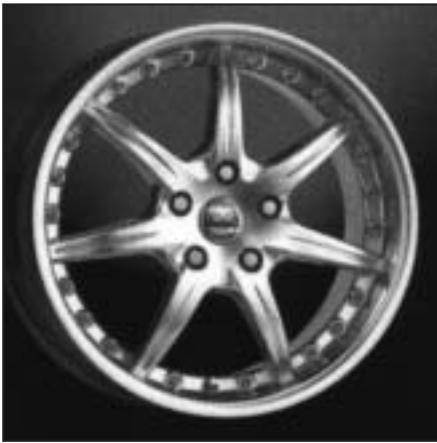
▲ 16.04 / 17.04 / 18.04