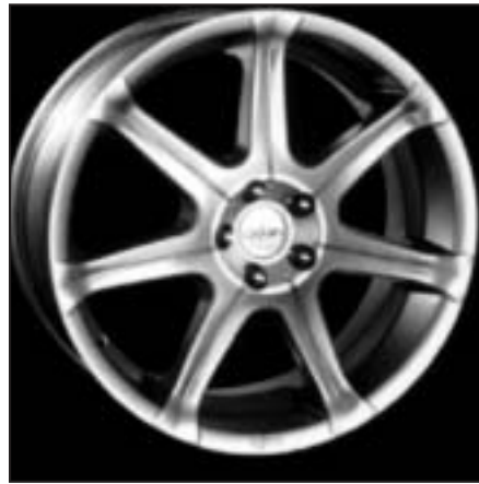
▲ 17.17 / 18.17