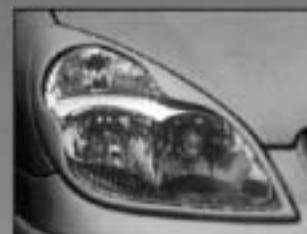
Headlamp Eyebrows (pair) CITC51003