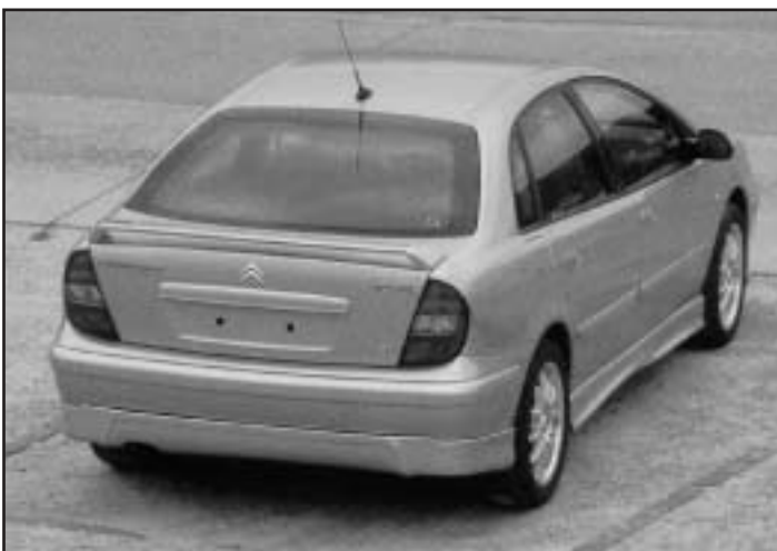
▲ 5.2 / 5.3 a / 5.4