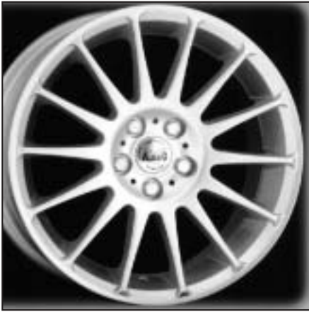
▲ 15.01 / 16.01 / 17.01