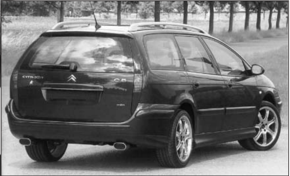
▲ 8.7 b