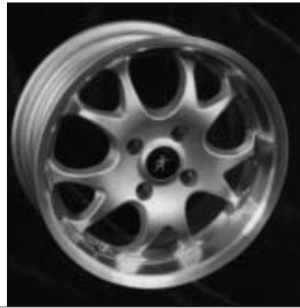
▲ 15.103 / 17.103