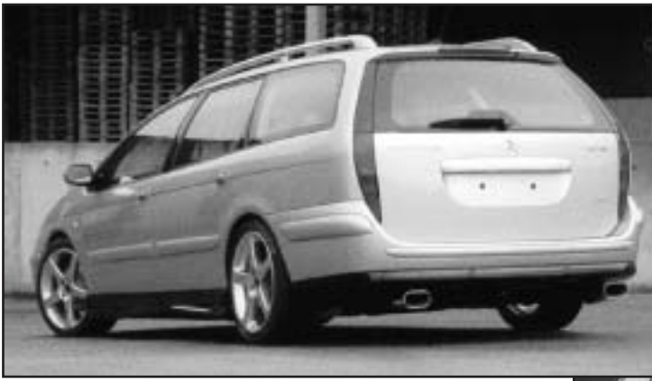
▲ 5.2 / 8.7 b