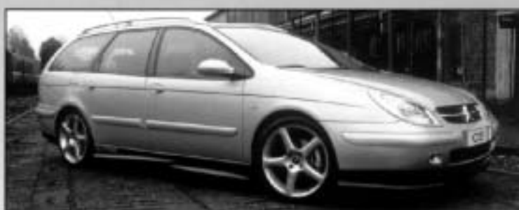
Cituning Side Skirts (pair) CITC51007