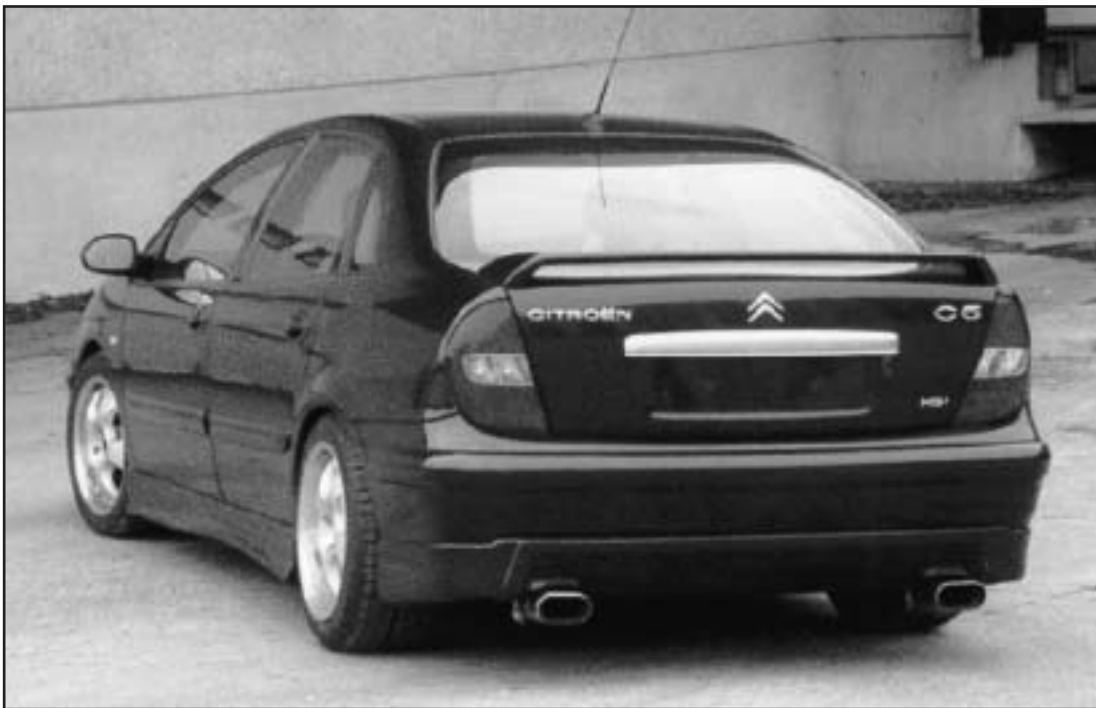
▲ 5.2 / 5.3 b / 5.4 / 8.7