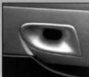
Front Bumper Air Intakes (pair) CITC51010