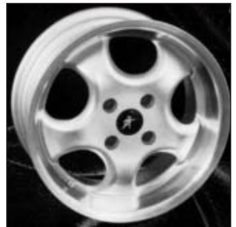
▲ 15.108 / 16.108