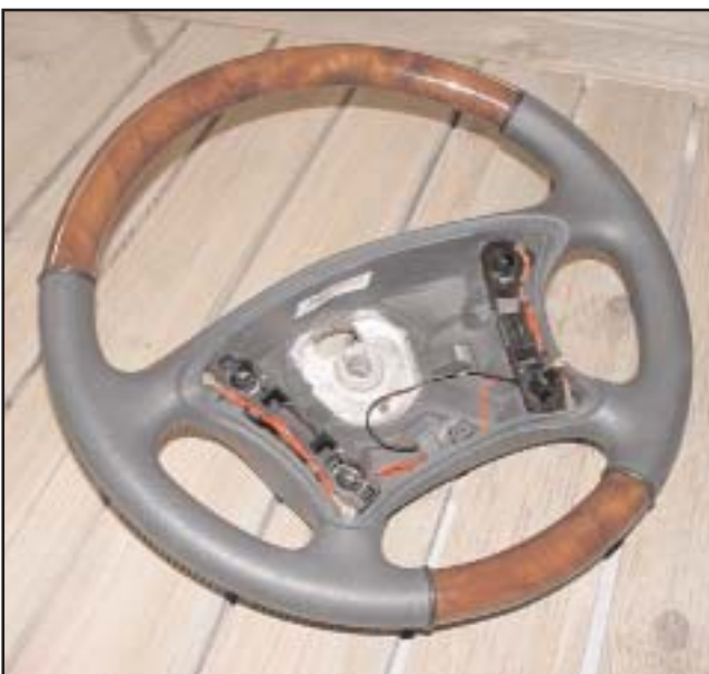
▲ 3.3 a