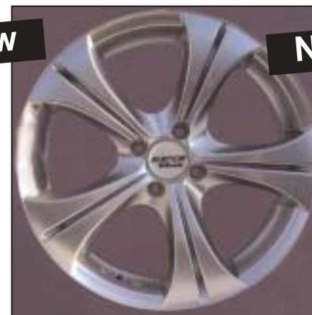
▲ 15.32 / 17.32