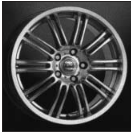
▲ 16.05 / 17.05 / 18.05