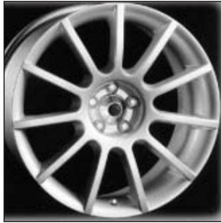
▲ 15.02 / 16.02 / 17.02