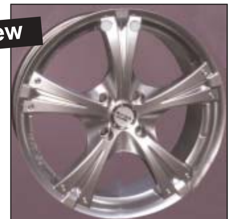
▲ 15.33 / 17.33