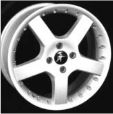
▲ 15.100 / 17.100