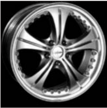
▲ 17.16 / 18.16