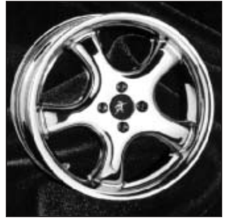
▲ 15.102 / 17.102