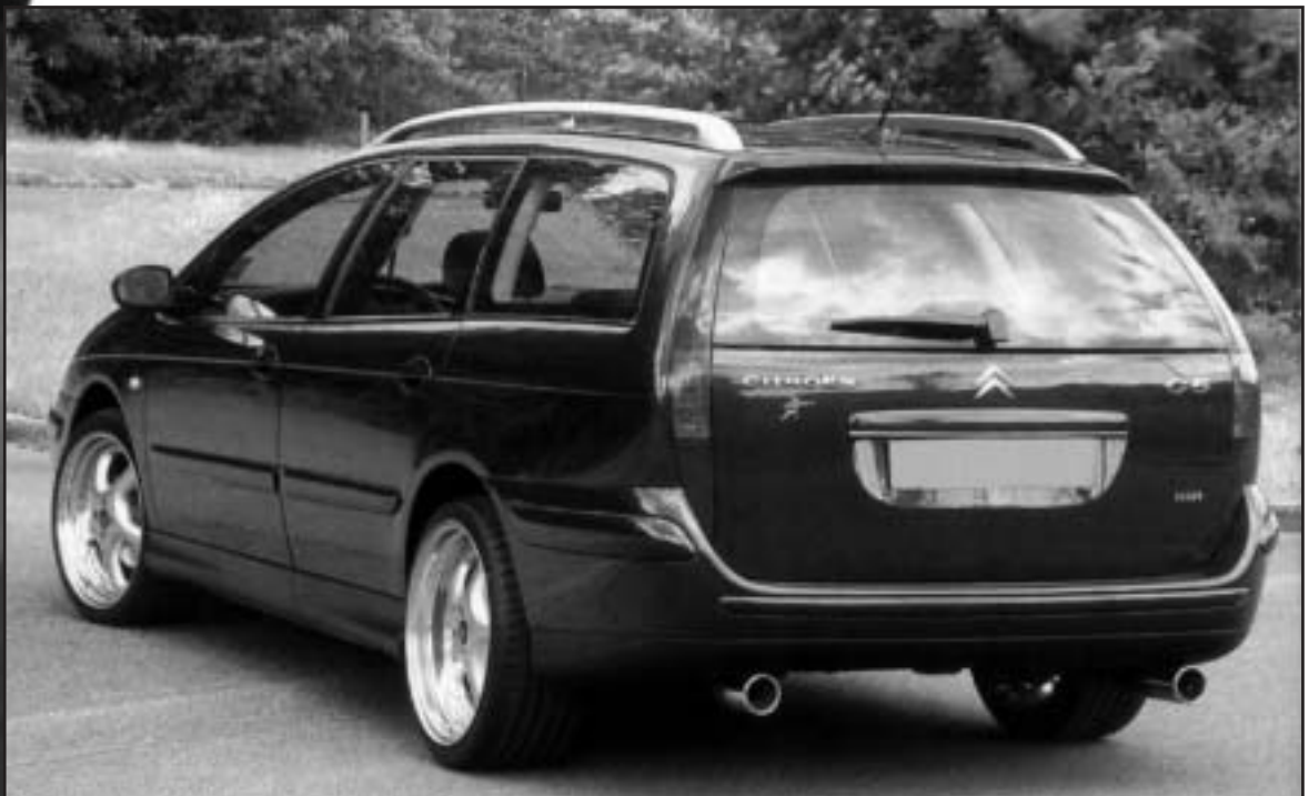
▲ 8.6 b