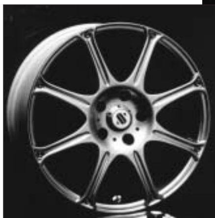
▲ 15.64 / 17.64