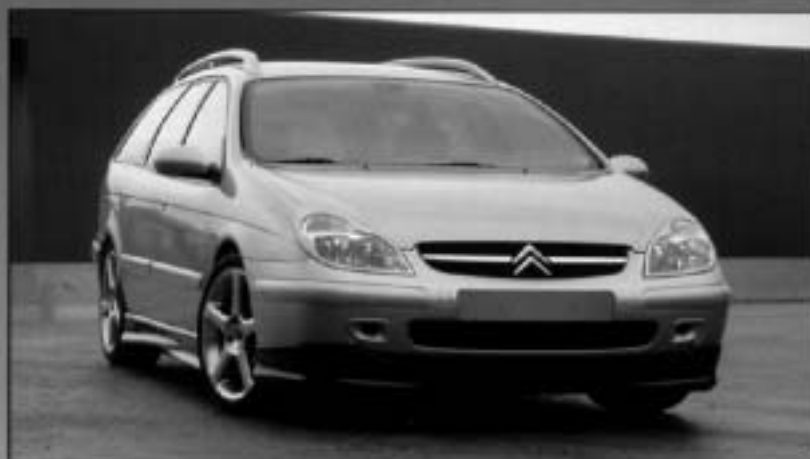
Cituning Front Spoiler CITC51005