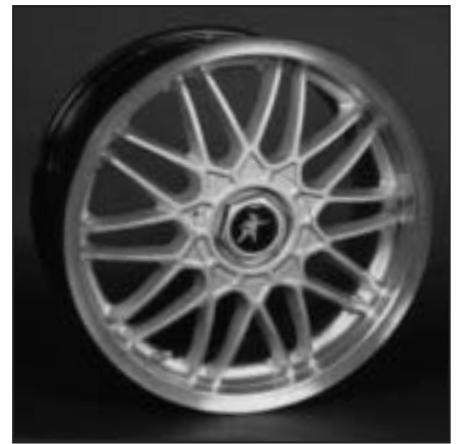
▲ 16.107 / 17.107 / 18.107