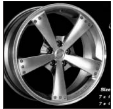
▲ 15.19 / 17.19 / 18.19