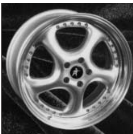
▲ 18.118 a/b/c/d/f 19.01 / 02 / 03 / 04