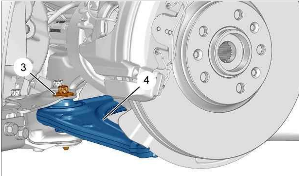
Рисунок : V3CM04ED

Снимите болт (3). Отсоедините нижний рычаг подвески от опоры переднего поворотного кулака.