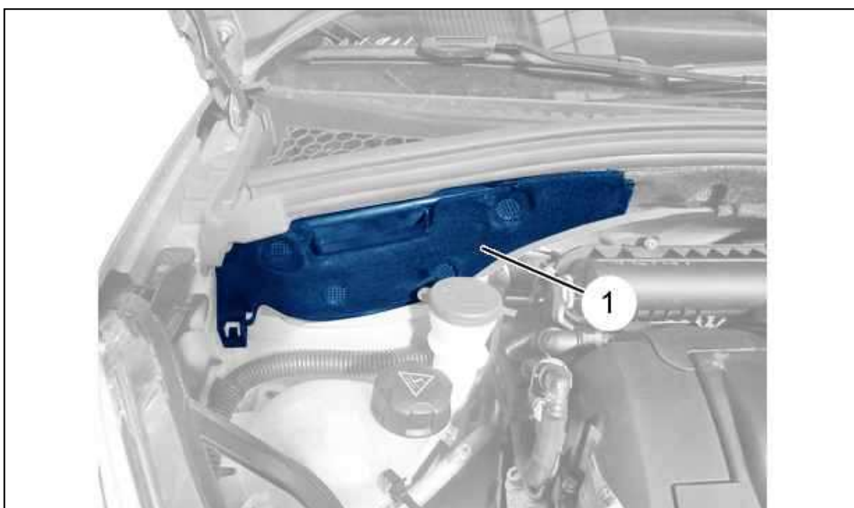
Рисунок : C5HG0FQD

ВНИМАНИЕ : Фильтрующий элемент состоит из 2 противопылевых фильтров различных размеров.