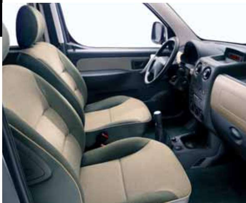
▶ Стиль «Cedre»

— Ткань «Checkmate» с оранжевой окантовкой сидений — Декоративные элементы передней панели, накладка ручки рычага коробки передач, передние дверные ручки — оранжевые; фон указателей приборной панели — серый, с металлическим блеском — Сетчатые вещевые карманы «медного» цвета