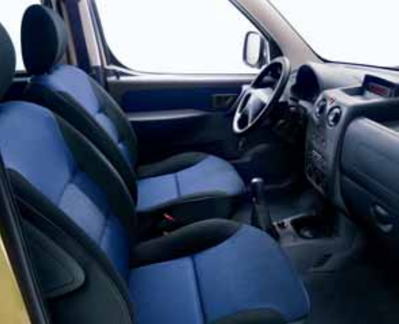
◀ Стиль «Cobalt» — Ткань «Shading»