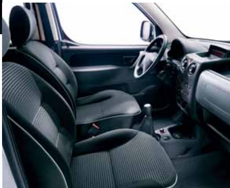
▶ Стиль «Titane»