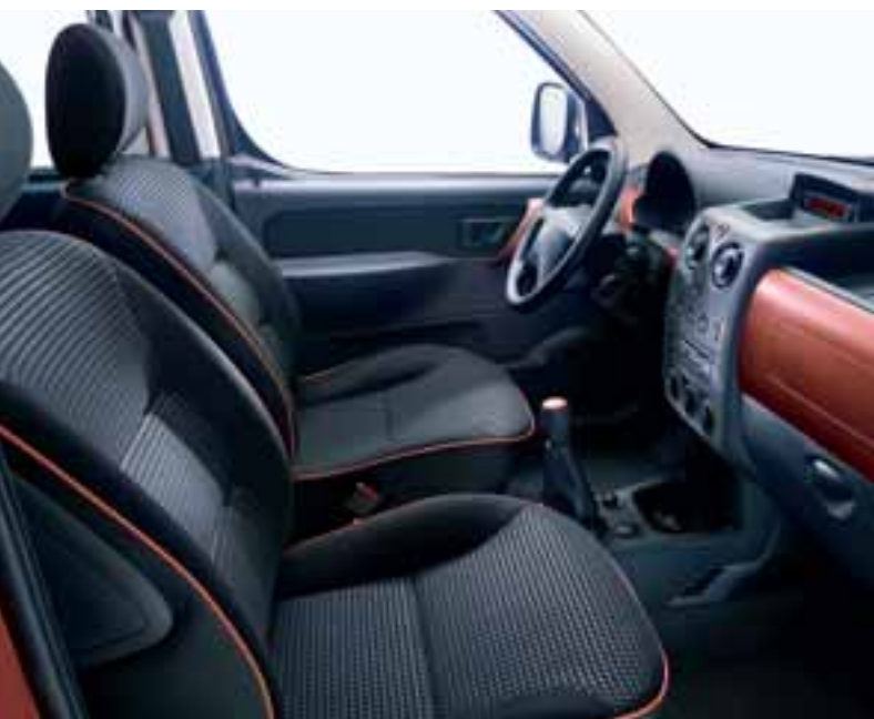
▶ Стиль «Mandarina»

— Декоративные элементы передней панели, накладка ручки рычага коробки передач, передние дверные ручки и фон указателей приборной панели — серые, с металлическим блеском — Плетеные из шнура вещевые карманы