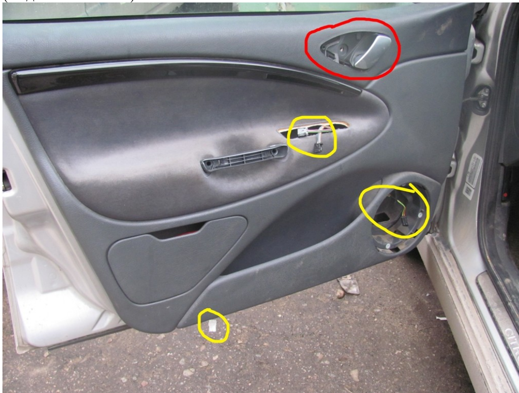
Фото этой заглушки на ручку открывания. (фото 13, 14)

Фото повешенной обшивки (фото 10) Не забываем вывести в отверстия провода (выделено желтым).