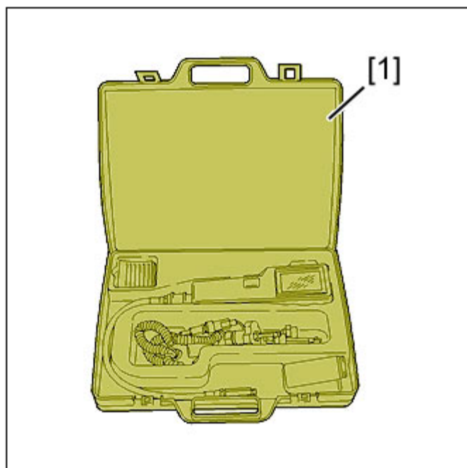
Рисунок : E5AP17BC