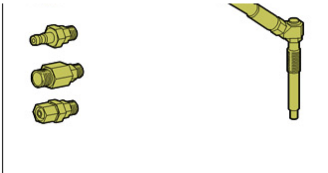
Рисунок : E5AP1JPC

[ 2 ] Имитатор свечи зажигания (-).0188 U.