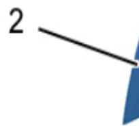
Рисунок : C5JG3CIP