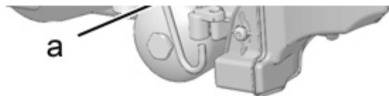
Рисунок : B2CP4BFD

ВНИМАНИЕ : В случае нового бачка, сорвите язычок (1), чтобы освободить соединение с атмосферой.