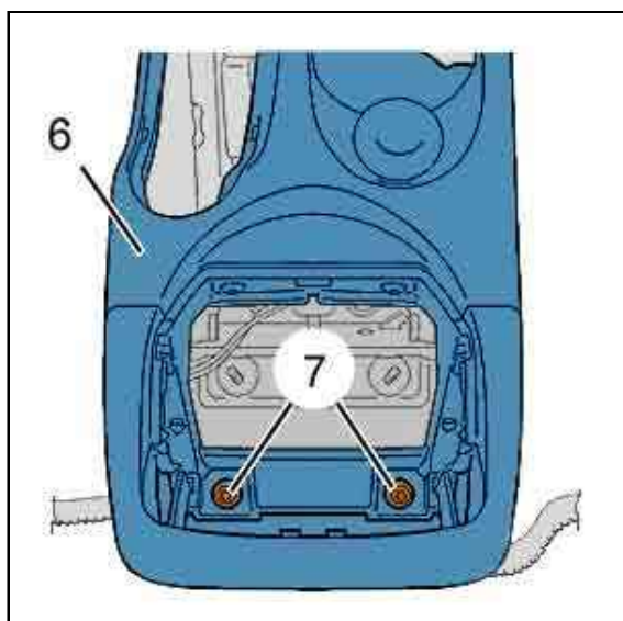
Рисунок : CSFP0ALC